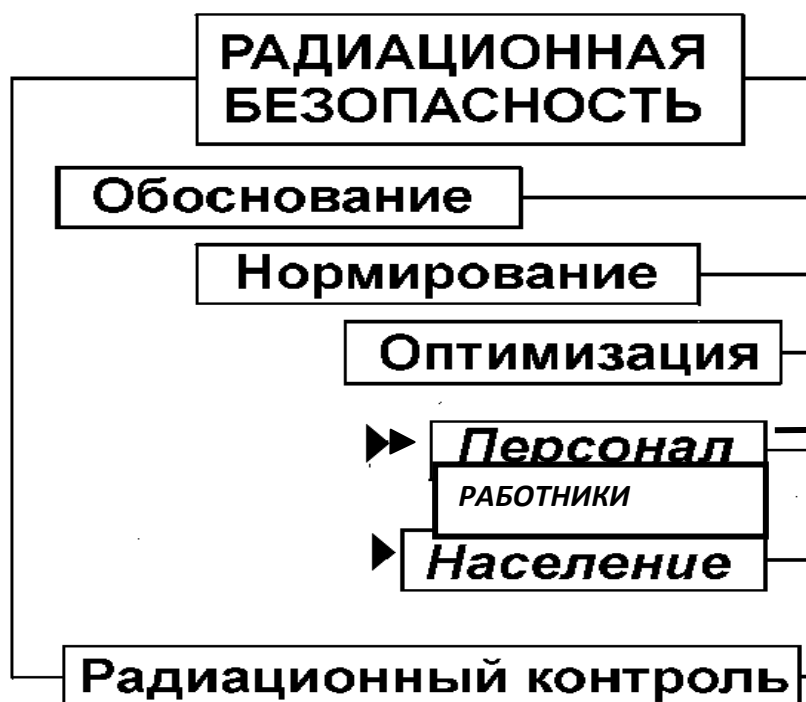
Рис. 7. 1. Система радиационной безопасности в России

Правовые, нормативные, практические и другие аспекты обеспечения радиационной безопасности в России нашли отражение в целом ряде документов различного уровня, начиная с Федеральных Законов и заканчивая отраслевыми методиками. В комментируемом здесь разделе, посвященном требованиям к контролю за выполнением Норм, содержатся наиболее общие положения, касающиеся этого вопроса. Все детали и специфика различных видов радиационного контроля являются предметом документов более низкого уровня.